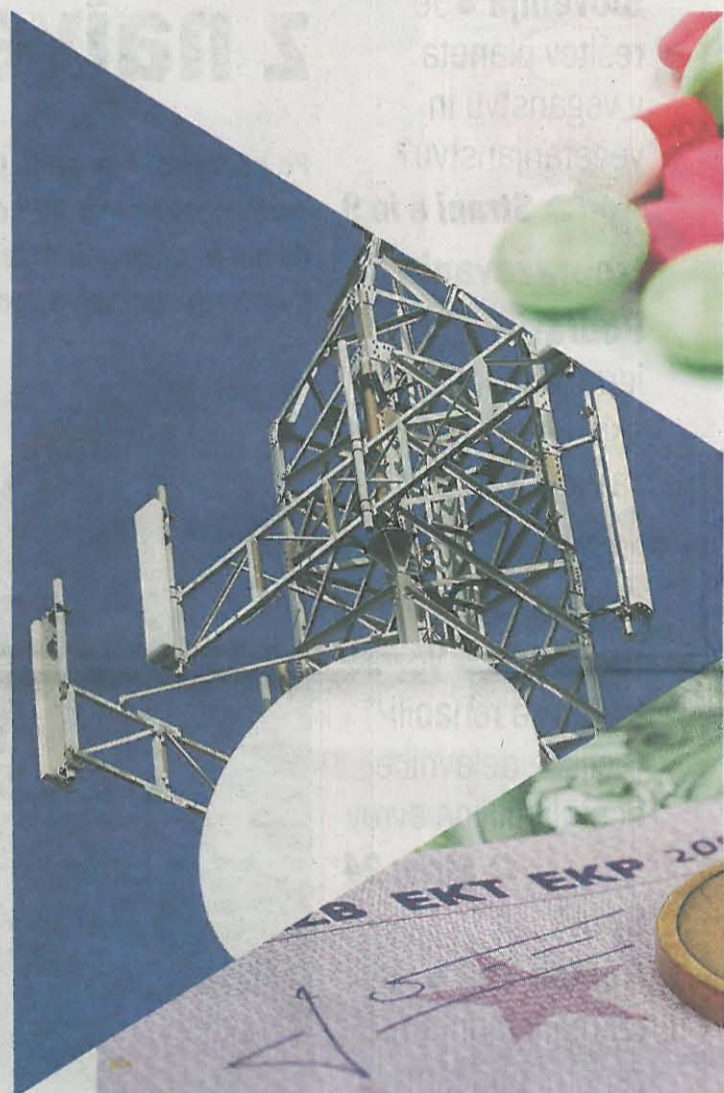
Davek od dobička pravnih oseb je prihodek državnega proračuna. Steka na območju mestne občine Ljubljana – v desetih letih skoraj tri milijarde niti Podravja, so podjetja v desetih letih skupno plačala toliko davka,

Ker vsa podjetja še niso predložila konsolidiranih in revidiranih poslovnih poročil, rok je 31. avgust, dokončni